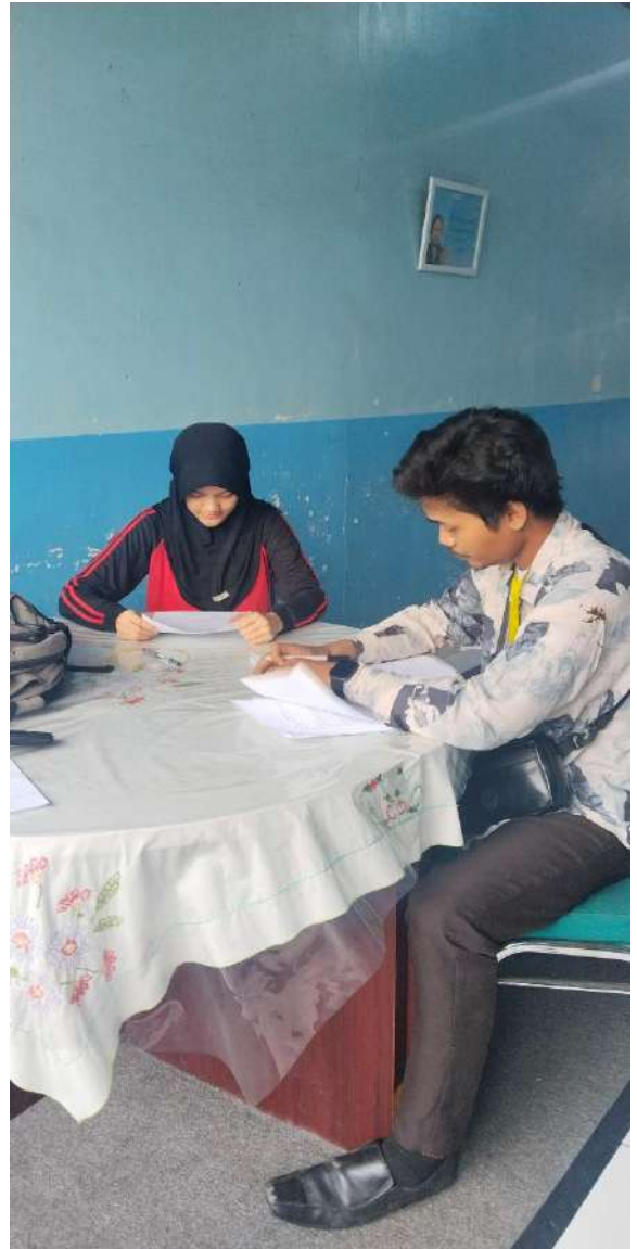
Foto kegiatan wawancara dengan para siswa dan siswi SMPN 186 Jakarta dari Kelas VII sampai