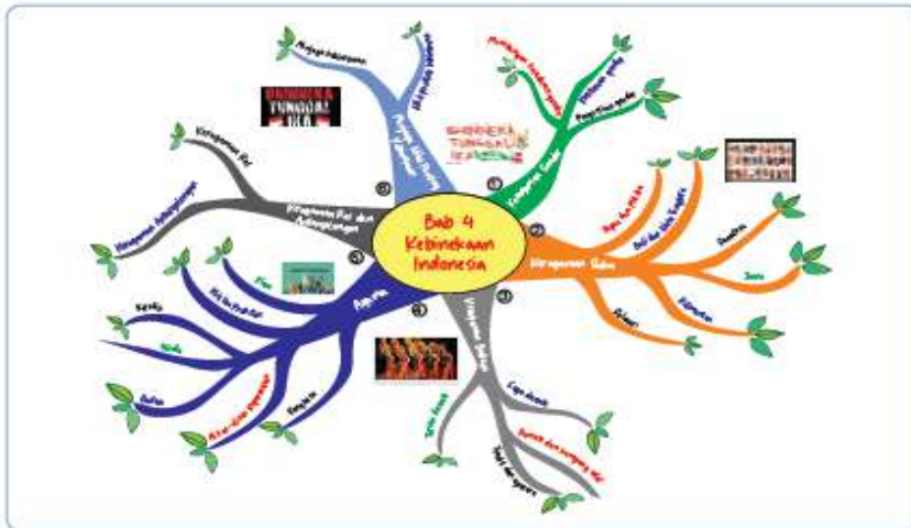
Gambar 4.1 Pemetaan Pikiran Kebinekaan Indonesia