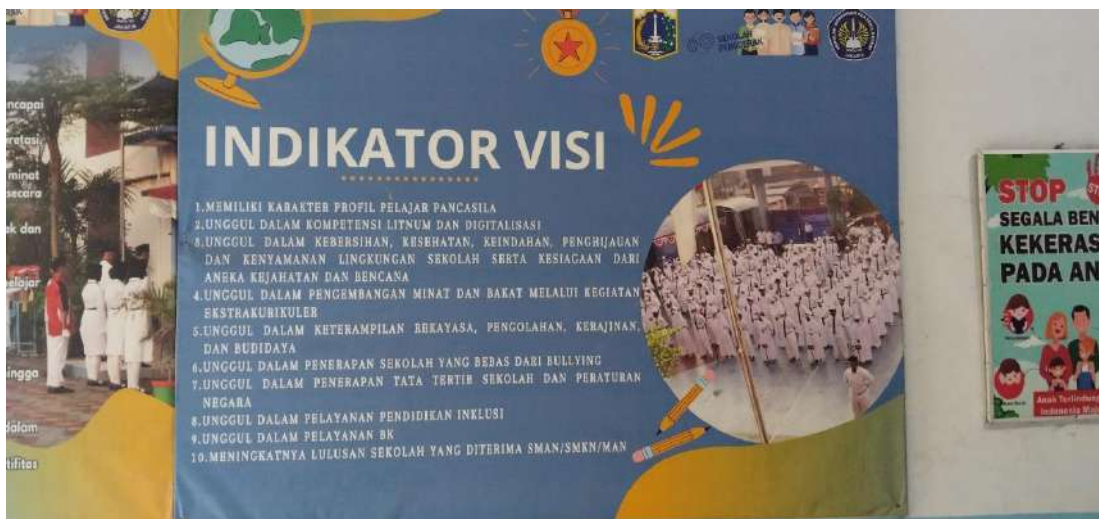
Visi dan Misi Sekolah