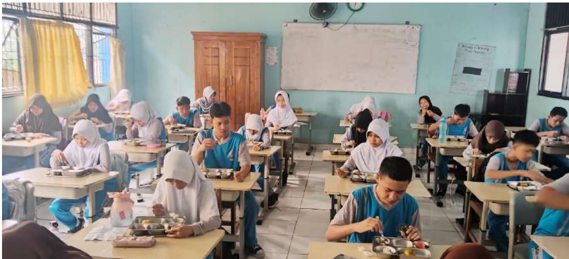
Foto Kegiatan Makan Siang Gratis Bersama