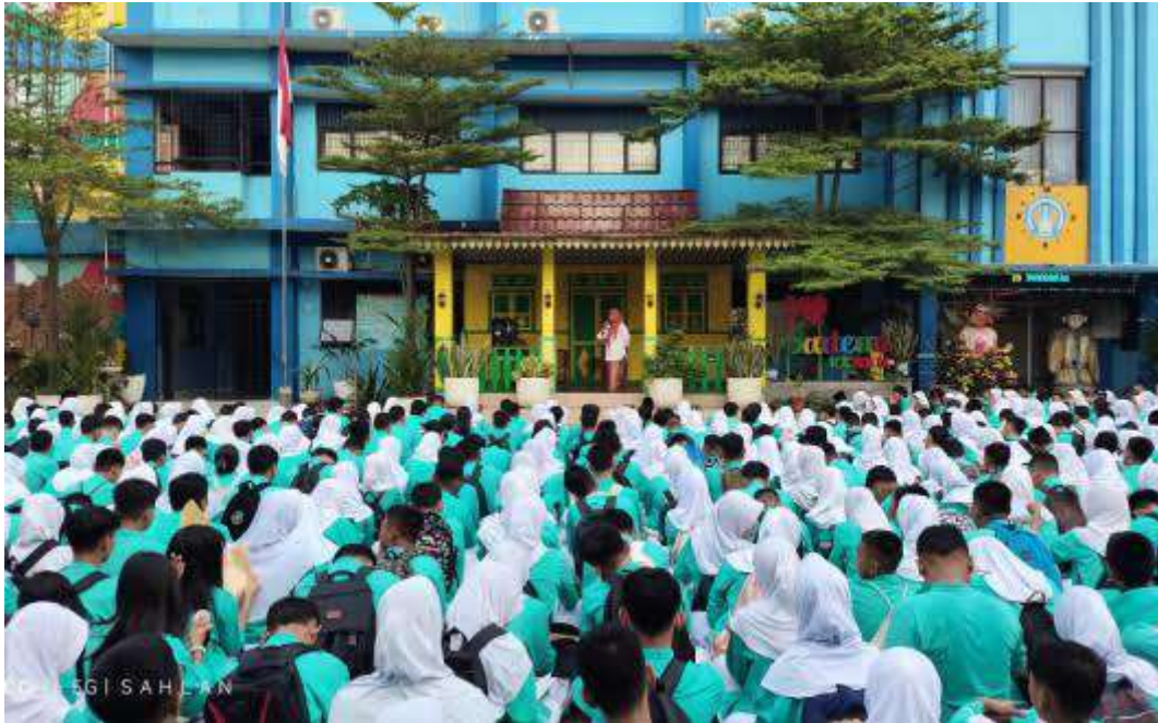
Foto Kegiatan Pembiasaan di Hari Jum'at