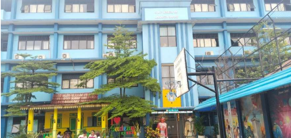
Foto Gedung SMPN 186 Jakarta