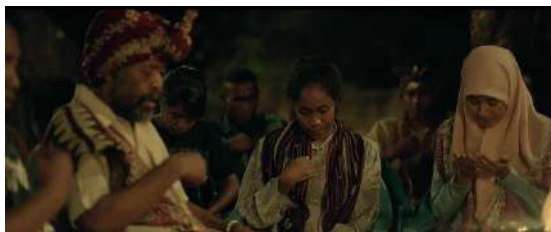
Gambar 3. 6 Adegan Keempat (Aisyah dan Warga Berdo'a sebelum Makan)

Siku Tavaréz : “Tapi mau kasih makan ibu guru apa? Orang Islam tidak makan daging Babi.”