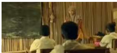
Gambar 3. 19

Adegan Ketujuhbelas (Murid- murid di beri pilihan)